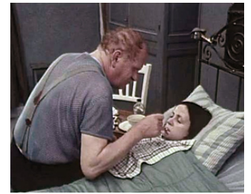
1974 PARCELLE BRILLANTE, Histoires insolites de Christian de Chalonge avec Gert Froebe