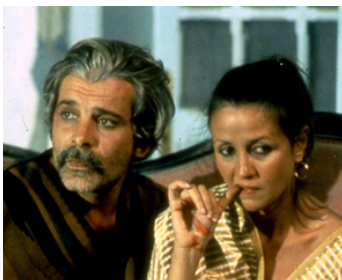
1984 UNE VIE SUSPENDUE (Gazl el banat) de Jocelyne Saab avec Jacques Wéber