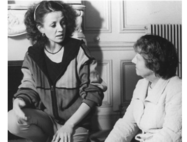
1980 GUNS de Robert Kramer avec Béatrice Lord