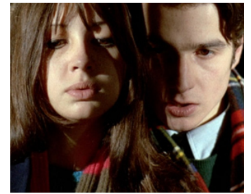
1968 LE GAI SAVOIR de Jean-Luc Godard avec Jean-Pierre Léaud