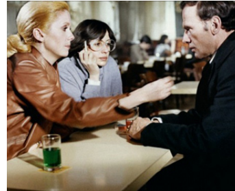
1978 L'ARGENT DES AUTRES de Christian de Chalonge avec C. Deneuve, J-L. Trintignant