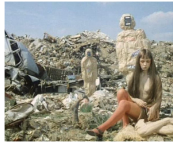
1969 JE, TU, ELLES de Peter Foldes