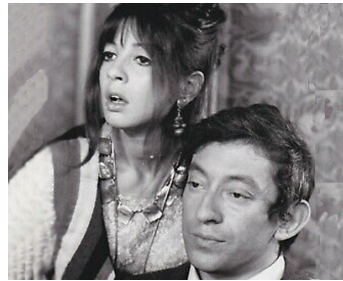
1968 SLOGAN de Pierre Grimblat avec Serge Gainsbourg