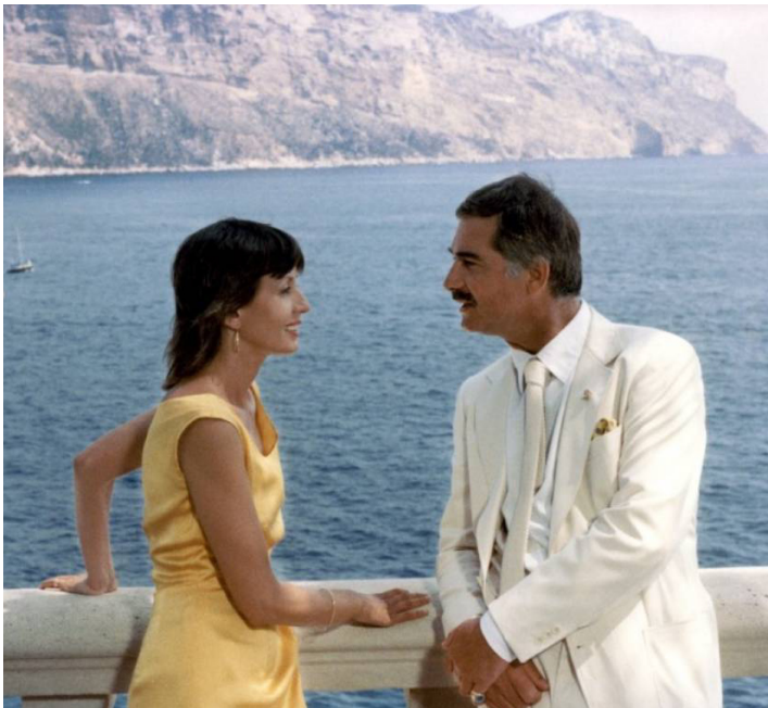
1982 CAP CANAILLE de Juliet Berto et Jean-Henri Roger avec Jean-Claude Brialy