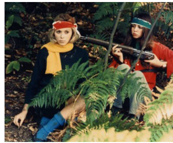
1967 WEEK-END de Jean-Luc Godard avec Mireille Darc