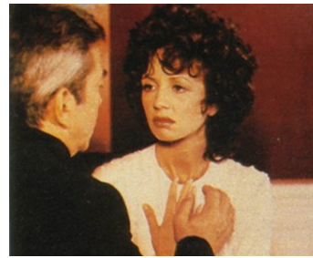
1974 LE PROTECTEUR de Roger Hanin avec Georges Géret