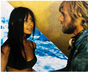
1968 UN ÉTÉ SAUVAGE de Marcel Camus avec Nino Ferrer