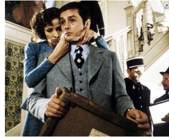
1976 MONSIEUR KLEIN de Joseph Losey avec Alain Delon