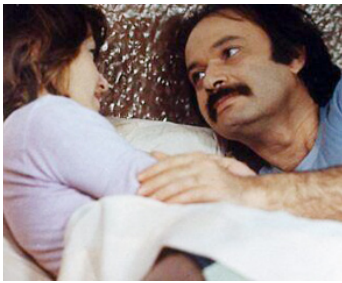
1974 LE MÂLE DU SIÈCLE de Claude Berri avec Claude Berri