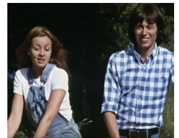
1972 LES CAÏDS de Robert Enrico avec Patrick Bouchitey