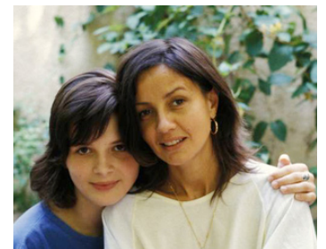
1984 LA VIE DE FAMILLE de Jacques Doillon avec Juliette Binoche