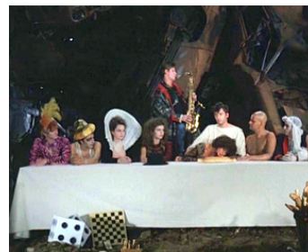
1983 LE CIMETIÈRE DES VOITURES de Fernando Arrabal avec Alain Bashung