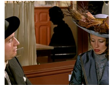
1981 MOI, L'AUTRE (Conversa acabada) de João Botelho avec Jorge Silva Melo