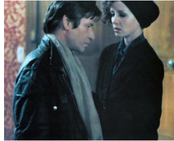
1975 DUELLE/LES FILLES DU FEU de Jacques Rivette avec Jean Babilée