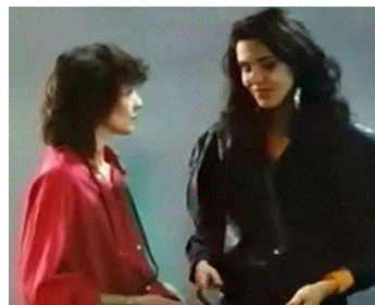
1986 UN AMOUR À PARIS de Merzak Allouache avec Catherine Wilkening