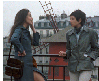
1970 OUT ONE, Noli me tangere et Spectre de Jacques Rivette avec Françoise Fabian