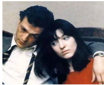
1974 LE MILIEU DU MONDE d'Alain Tanner avec Philippe Léotard