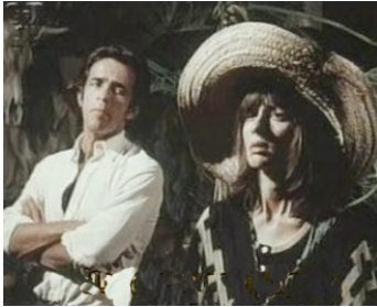
1975 CLARO (Claro) de Glauber Rocha avec Mackay