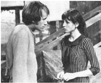
1971 À LA MÉMOIRE D'HÉLÈNE d'Abder Isker avec Yves Rénier