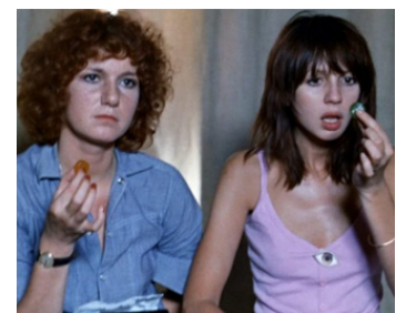
1974 CÉLINE ET JULIE VONT EN BATEAU de Jacques Rivette avec Dominique Labourier