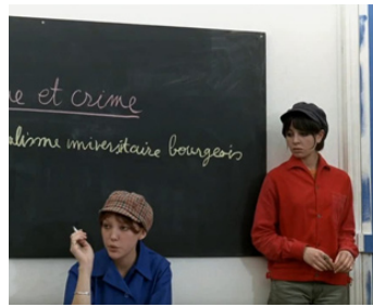
1967 LA CHINOISE de Jean-Luc Godard avec Anne Wiazewski