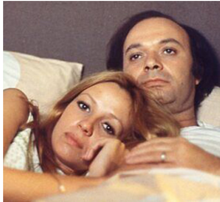
1973 SEX SHOP de Claude Berri avec Claude Berri