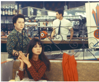
1966 DEUX OU TROIS CHOSES QUE JE SAIS D'ELLE de Jean-Luc Godard