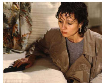
1987 LE TEMPS D'ANAÏS, L'Heure Simenon de Jacques Ertaud